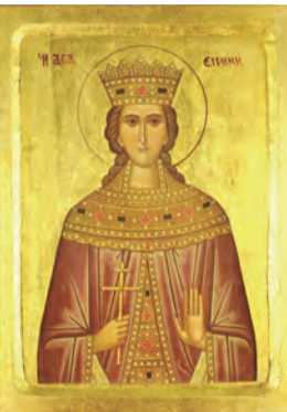
▲圖3「聖艾琳的馬鞭草」乳香（左）與聖艾琳聖像畫（右）。