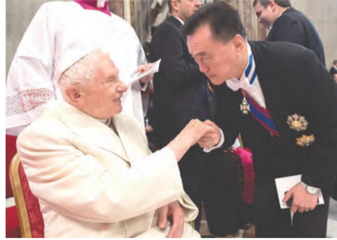
▲王豫元大使親吻退隱教宗本篤十六世的手