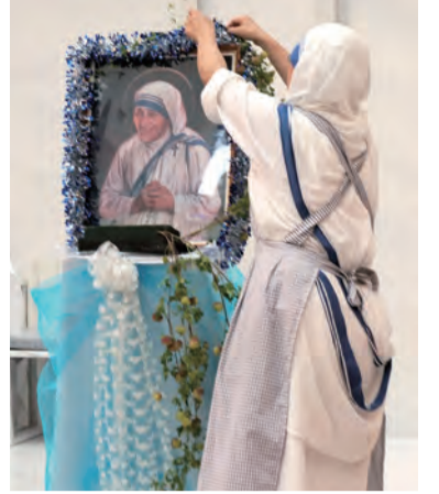
▲適逢聖德蘭姆姆列聖3周年慶，仁愛傳教修女會在聖方濟天主堂為慶祝彌撒歡喜布置