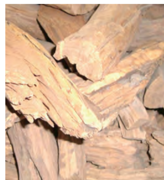
▲圖4：「埃德薩的檀香」乳香。（取自修道院官網）