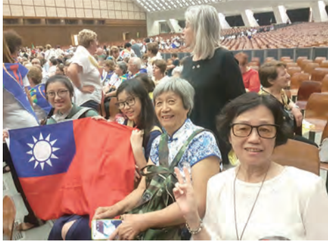
▲在保祿六世大廳與教宗一起慶祝175周年慶