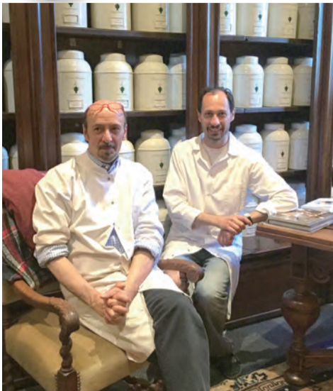
▲圖1：雪維凍泥爾乳香工作坊的主力神父們。

教宗方濟各勉勵我們每天花15分鐘的時間與天主談話、祈禱，很多人做不到，可能是因為沒有從旁協助的工具，好讓心平靜下來；一旦點了乳香，從點燃至燒盡，也不過15至20分鐘的時間，在這段時間中，嗅著芳香的氣息，尤其是點燃有玫瑰香氣的乳香時，更能感受到聖母環抱著我們，等著聆聽我們的祈禱，好為我們向天主代禱。在薰香中默禱，順著乳香冉冉上升的香煙，向天主傾訴我們的祈禱及渴望。