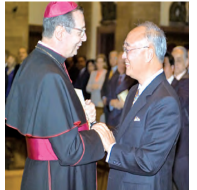
▲教廷外長拉約洛Giovanni Lajolo 總主教祝賀杜筑生大使受洗