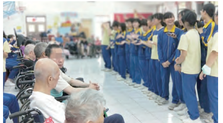
▲曙光女中修女及師長帶領的樂活營關懷服務，同學們以精彩表演陪伴長輩。