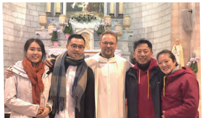
▲在加納一對夫妻重發婚姻誓願，為一對青年舉行訂婚。 ▲在耶穌與厄瑪烏門徒擘餅的祭台前大合照