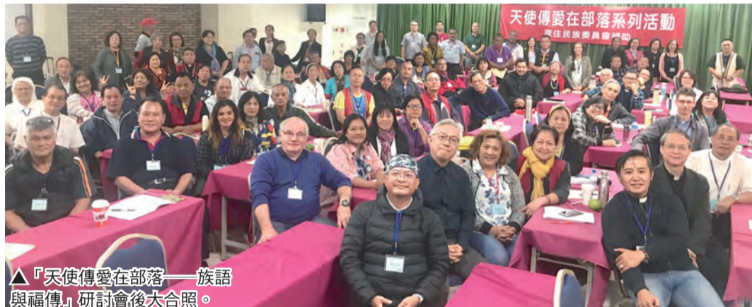
▲「天使傳愛在部落——族語與福傳」研討會後大合照。

由主教團原住民牧靈委員會籌畫多時的「天使傳愛在部落——族語與福傳」研討會於10月24日(周四)至25日(周五)兩日,在大坪林「天下一家」舉辦。出席人員都是原住民族部落推動與實踐者,以及天主教會在原住民族部落負責牧靈福傳的神職人員、修女、傳道員與幹部;研習人數多達110人。