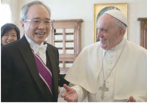
▲李世明大使呈遞國書後與教宗方濟各歡談