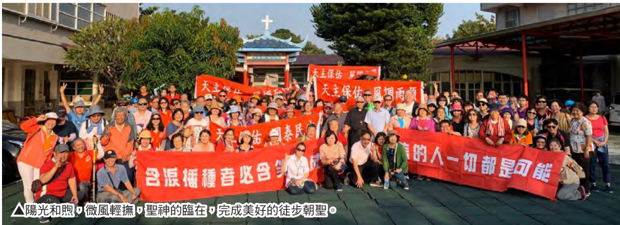
▲陽光和煦，微風輕撫，聖神的臨在，完成美好的徒步朝聖。

教宗方濟各說：「傳教使命的主角是天主聖神，你與聖神同行。」是的，整個活動從開始到完成，都要感謝天主聖神的帶領下，我們在聖神光照下去思考、去執行、去體悟，才得以一一突破、順利完成。讓我們齊聲感謝天主、讚美天主！