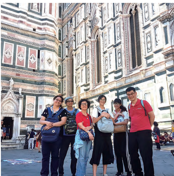
▲在佛羅倫斯百花大教堂前留影

朝聖之旅中，使我們的靈修與祈禱生活有了更上層樓的真實體驗，對於每日參與彌撒中的3篇聖言也有更多的感受與了解，真沒想到在我晚年竟能收到這份寶貴禮物，今生我要永遠讚美並感謝祂。阿肋路亞！