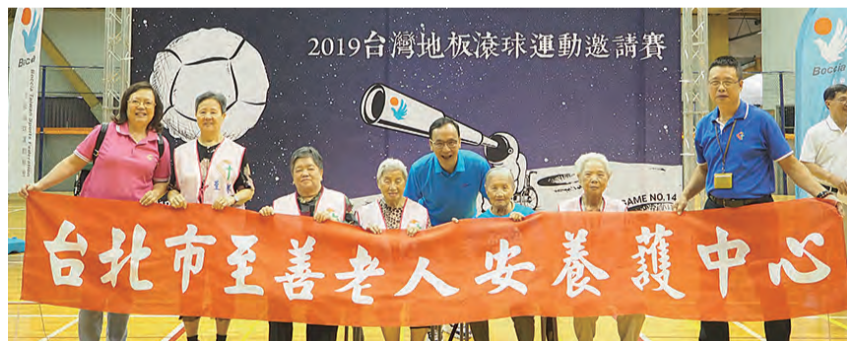
▲台灣地板滾球運動邀請賽，至善長者歡喜參與，開心合影。

等三大領域，除了腦性麻痺者外，擴及其他身心障礙族群，進而推展至銀髮長輩及兒童，期盼成為全民運動之一。