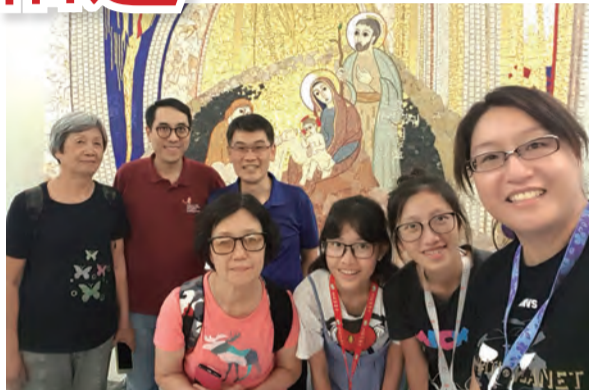
▲參觀羅馬耶穌會院

離開佛羅倫斯，我們搭乘火車來到亞西西這山中小城，車行到站的停留過於短暫，部分團員連同行李，差點無法順利下火車，就在我的行李被車門夾住的那一刻，車上一位黑衣青年，幫我們抵住車門不讓它關閉，又向站長大聲提醒，剩下的團員才得以順利下車，火車開走後，大家驚魂未定；當晚的省察後分享，感謝天主派遣那青年助我們一臂之力，有位青年分享，希望自己可以成為那樣的青年，在別人需要幫助時伸出援手；正因為曾經獲得幫助，