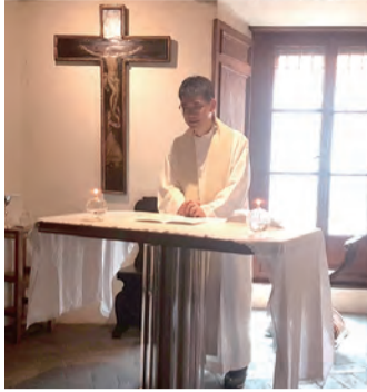
▲在羅馬依納爵的房間彌撒