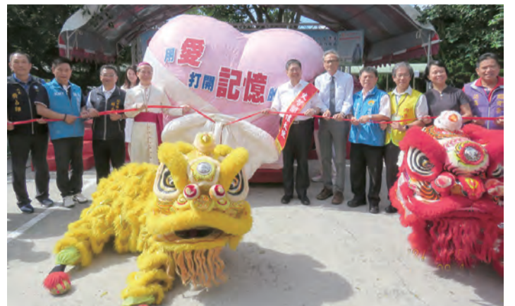
▲在舞獅隊導引之下，來到寧園安養院的貴賓們展開「為記憶而走」的健走活動，一起支持失智照護體系。

果子，除了天主的眷顧，還要感謝盡責的工作團隊，無私共融地合作，專業認真的社工群，給予住民妥善的資源安排與照顧連結、福利諮詢、家屬支持系統、志工的動員、組織與招募；優秀又充滿活力的護理師、教保菁英團隊，提供住民有品質的日常生活照護服務及多采多姿的課程，日常功能訓練、社交、認知、體能訓練；怡情活動的照顧則包括園藝輔療、職能治療、多感官等多元、有趣、有助減緩退化的課程，讓住民在專業的帶領下，開心悠活。