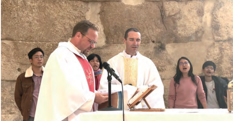
▲白神父和斯德望神父在厄瑪烏朝聖地慶祝彌撒