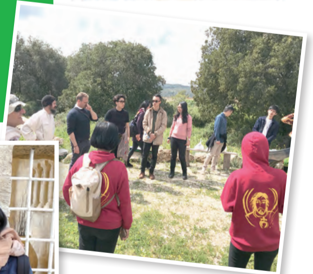
▲在耶路撒冷白冷隱修院聆聽浪高手快樂修士的聖召見證 ◀耶路撒冷FM Maronite修會聖堂彌撒

來到革責瑪尼山園旁的地下洞穴中，看到聖母升天前躺的那塊石板，我們在那裏親吻了耶路撒冷聖母的畫像。一直以來，許多人因著在這畫像前祈禱而發生奇蹟。最後，在海法海星聖母修道院裡，再次的把自己奉獻給聖母，並領受聖衣。我在這裡祈禱時，感到聖母真實的臨在。在一次次的屬靈征戰中，聖母的力量堅強了我，加俾額爾天使和真福白冷瑪利亞也和我一起，讓我的心靈變得更堅強與願意忍耐。感謝主！讚美主！ (全文完)