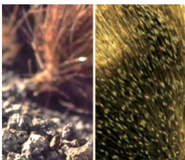
▲圖6：「7位沉睡者的玫瑰」乳香。▲圖7：「舍巴女王的麝香」乳香。