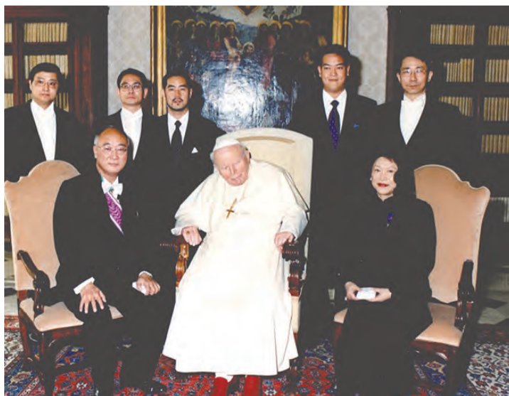
▲杜筑生大使呈遞國書後闔府及館員與教宗若望保祿二世合影