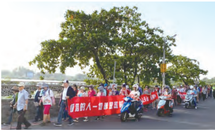
▲隊伍喜樂行走，青年們如蜜蜂般地為維護安全而忙碌。