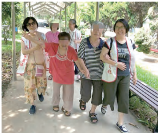
▲社工帶領永和社大社會關懷社溫馨服務，陪伴長輩在寧園綠意盎然的院區散步。