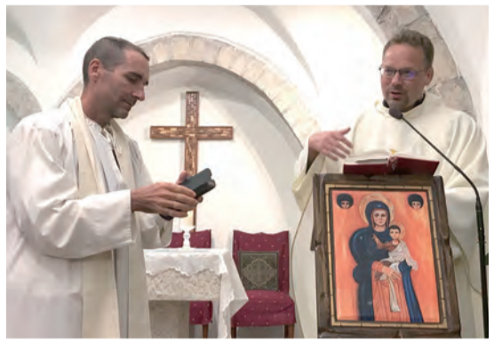
▲耶路撒冷FM Maronite修會聖堂彌撒