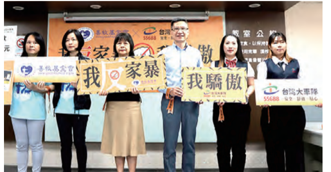
▲善牧基金會與台灣大車隊，邀請社會反家暴，單筆捐款滿3000元，即可獲贈台灣大車隊搭車金及飛狼Yuppie手提後背包，為建立友善女性環境盡心力。